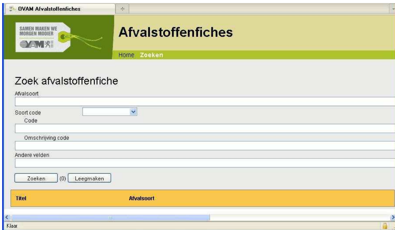
Figuur 2: Zoekscherm

De zoekvelden zijn niet hoofdlettergevoelig .