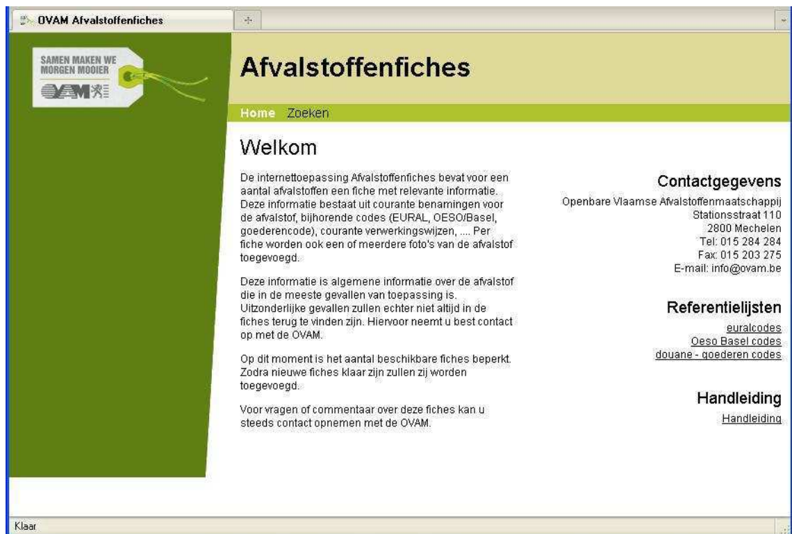
Figuur 1: Startscherm

Op het startscherm staan bovenaan 2 opties in het menu: 'Home' en 'Zoeken'. Door op 'Home' te klikken, kom je weer op het startscherm. Wanneer je op 'Zoeken' klikt, ga je naar het zoekscherm.